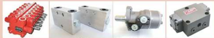
KYB製 KYB-E5製 ダンフォース製 高圧精研製 コントロールバルブ パイロットチェックバルブ 油圧モーター フローリバイダーバルブ