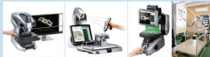
ワンショット3D形状測定機 3次元測定機 画像寸法測定器 油圧テストスタンド